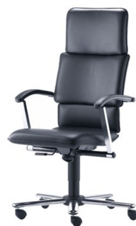
T-C10-A-D1-S aktiv lændestøtte højdejusterbare armlæn GV stål krom