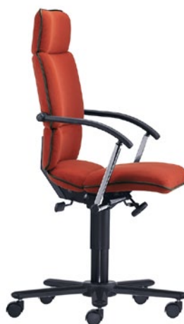
T-C8-A-D1-S aktiv lændestøtte højdejusterbare armlæn LS stål sort